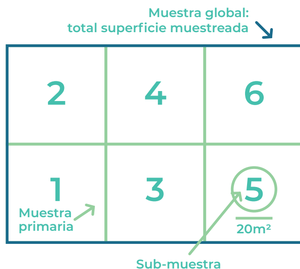
Figura 2. Esquema de muestreo aleatorio estratificado recomendado para superficies mayores de 10 hectáreas donde se muestran las 6 muestras primarias y las 5 sub-muestras en cada estrato o bloque.

Esquema de muestreo aleatorio estratificado recomendado para superficies mayores de 10 hectáreas donde se muestran las 6 muestras primarias y las 5 sub-muestras en cada estrato o bloque.